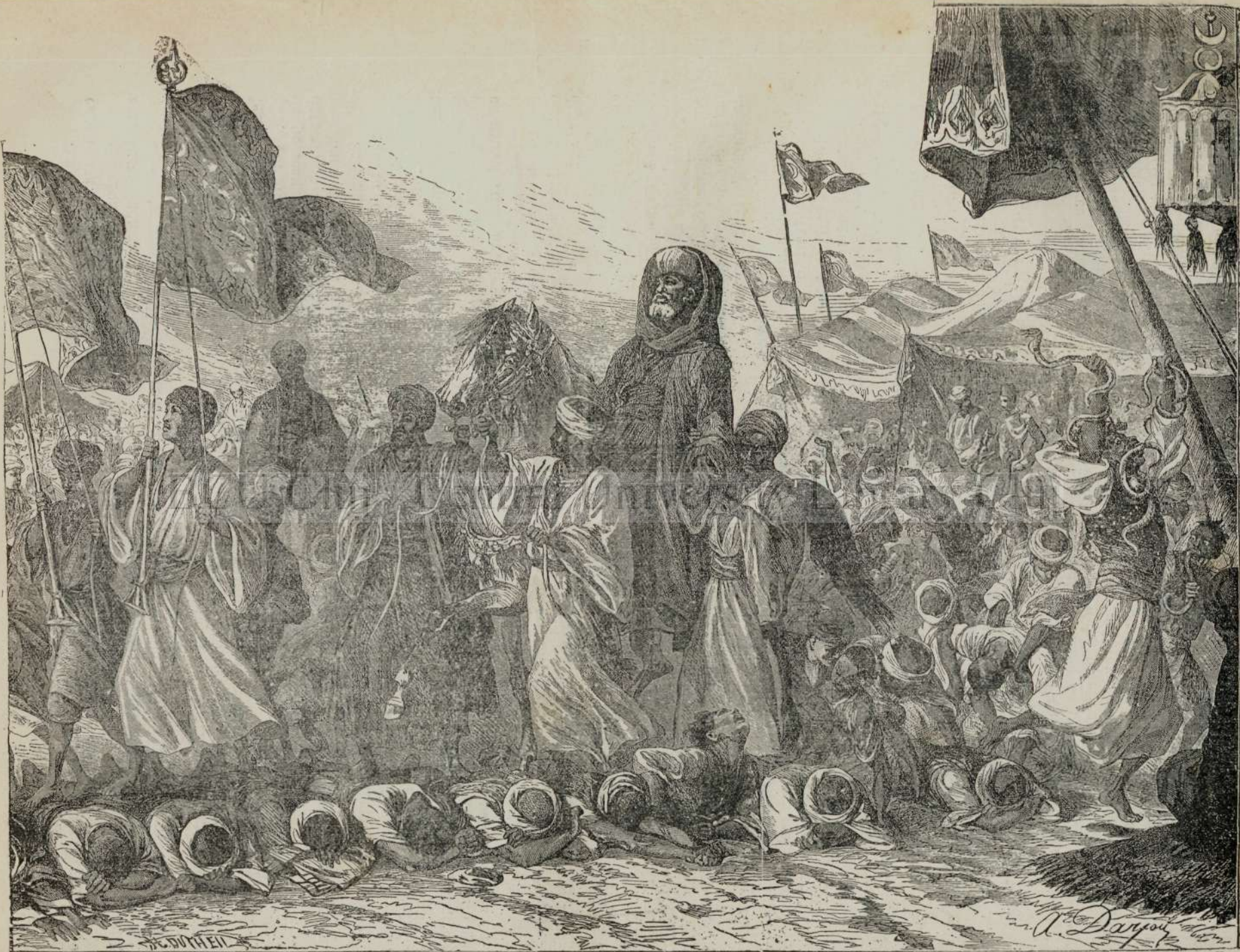
Peregrini mohametani re'ntorcându dela Meca.