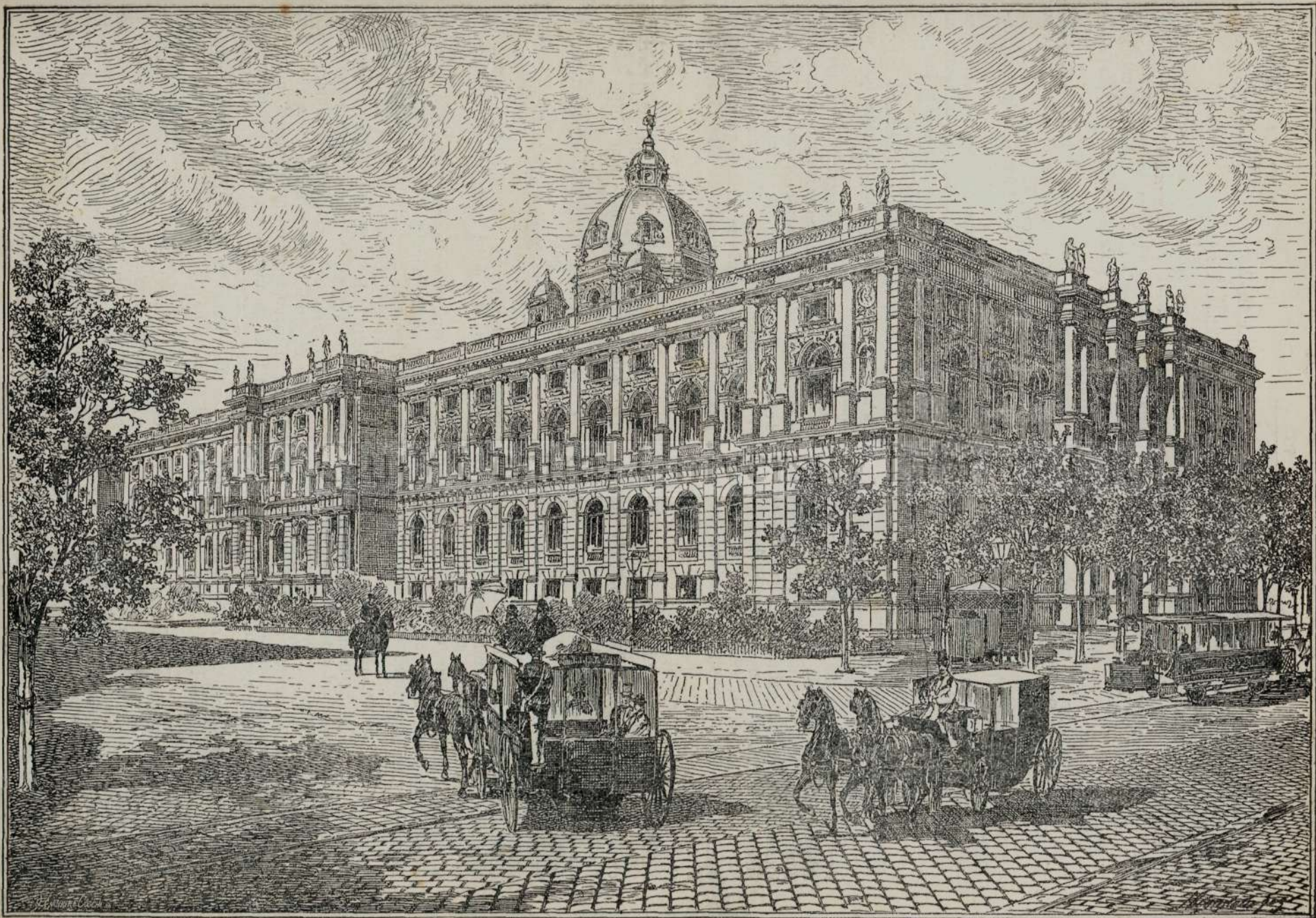
MUSEULU DIN VIEN'A.