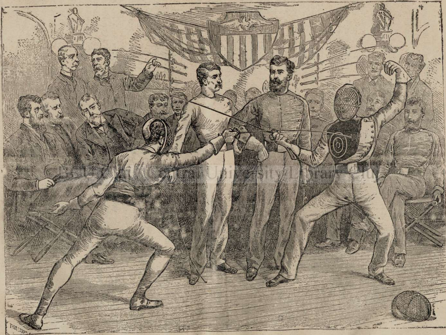
IN SCÓL'A DE DEPRINDERE.