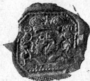
Fig. 2 Matei Ghica (1741)

Documentul cu această pecete datează din 1735, deci din prima domnie a lui Constantin-Vodă în Moldova, care începe la 16 Aprilie 1733, dată când el a fost transferat din Țara-Românească, unde domnise de două ori între Septembrie 1730 și Aprilie 1733. Deci putem fixa ca epocă de alcătuire a primei peceti cu stema unită anul 1733, după 16 Aprilie. Modul cum este alcătuită această stemă nouă pe pecetea