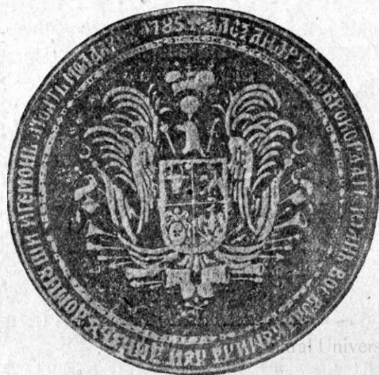
Fig. 4. Alex. C. Mavrocordat (1785)

celor două principate au fost așezate în așa fel, încât locul prim (dreapta eraldică) îl ocupă stema Moldovei și al doilea (stânga eraldică) stema Țării-Românești.