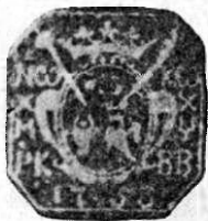
Fig. 3 C-tin Racoviță (1758) (dreapta eraldică) stema Moldovei și alături de ea (stânga eraldică) a Țării-Românești (Fig. 1).

din 1733 este foarte simplu: două medalioane așezate alături în câmpul pecetii, dintre cari primul (dreapta eraldică) conține stema Moldovei (capul de bou cu stea între coarne), iar al doilea (stânga eraldică) stema Țării-Românești (acvila cu cruce în cioc). Sus între medalioane o coroană, iar jos anul: 1733. 3)