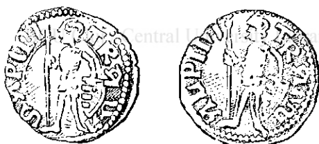
Fig. 1 și 2.

Cele mai vechi monete cu efigie, cunoscute astăzi, sunt dela Radu I, Domnul Țării-Românești. Ele îl reprezintă sub forma unui cavaler medieval, stând în picioare, cu coif pe cap, armură de fier pe corp și pe membre, și ținând în mâna dreaptă o luncie, în stânga scutul; acesta are primul cartier fasciat, al doilea plin (Fig. 1 și 2).