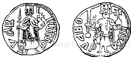
Fig. 3 și 4.

Dela Dan I, fiul mai mare și urmașul imediat al lui Radu I, nu avem până acum nici o monetă cu efigie, dar dela Mircea cel Bătrân, alt fiu al lui Radu și urmașul lui Dan I, există mai multe serii de monete de acest fel. Este caracteristic însă că nici una din ele nu reprezintă pe Domn în costum de cavaler, ci toate în portul domnesc cu care ne-au obișnuit portretele ctitoricești. Astfel în linii generale toate efigiile de pe monetele lui Mircea se aseamănă, și numai în privința atributelor Domnului, în anumite amănunte ale costumului și în ce privește modul de executare, se poate face o deosebire între ele. După aceste criterii efigiile monetare ale lui Mircea se grupează în următoarele categorii: