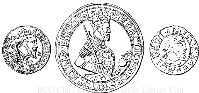
Fig. 11. 12 și 13.

Pe monetele de aramă înfățișarea Domnului diferă într-o cât-va. Se reprezintă numai capul, fără coroană, în locul căreia s'a pus o bantă lată, legată la ceafă într'un nod în genul antic. (Fig. 13).