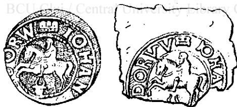
Fig. 16 și 17.

Ultimul Domn moldovean dela care ne-au rămas monete este Istrate Dabija. Piesele bătute în domnia lui fiind imitații de ale șilingilor poloni, suedezi și prusieni, copiază în mod servil originalele. Există printre ele însă mai multe serii, care poartă numele lui Dabija-Vodă și din cari unele au efigia lui. Pe aceste monete Domnul este înfățișat călărind în galop spre stânga; capul îi este descoperit, iar barba lungă până în piept. Haina nu i se distinge bine, dar în picioare pare a avea pantaloni strâmți. Sus, deasupra