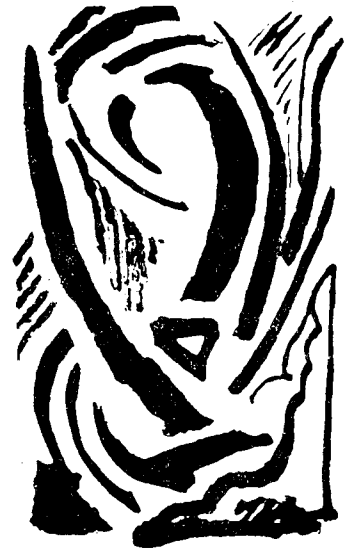
Compoziție: de A. Gheorghiu