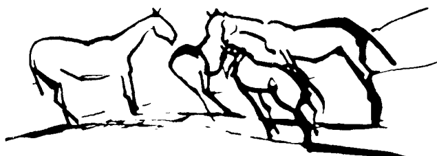
Desen de Fortuna Brulez