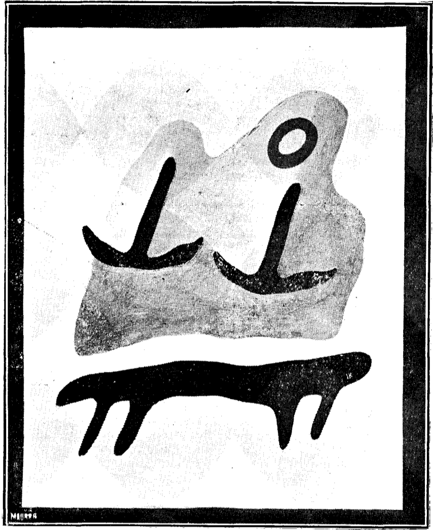
Hans Arp: „Ancore și ombilic, într'un munte pe bancă!”