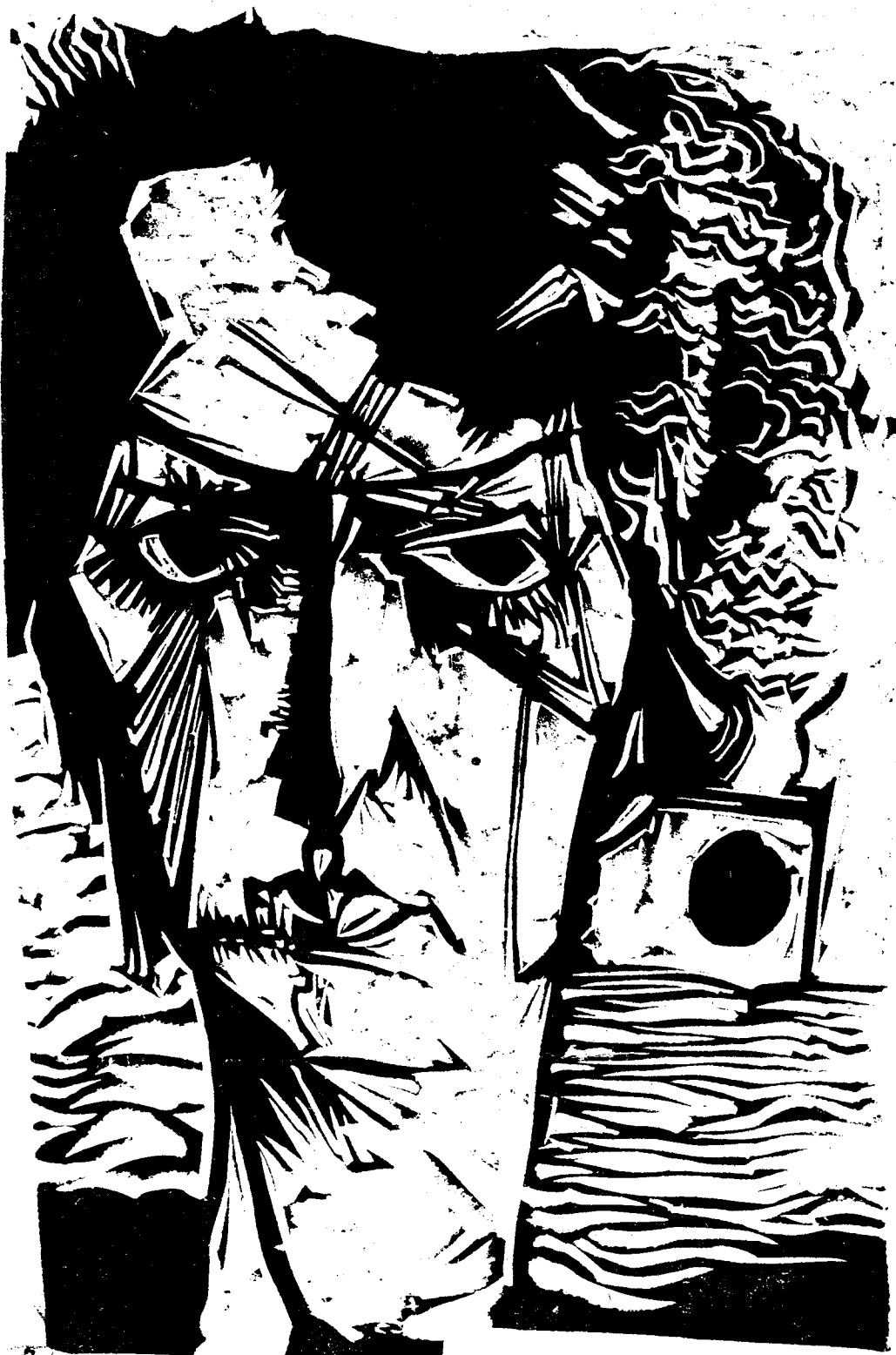
CLARA HASKIL, — Xilografie originală de Marcel Iancu