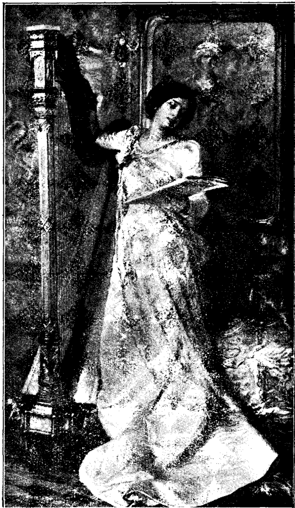
A. Mollica: O elegie. După originalul din salonul parisian 1912.

Cererea noastră atât de justă se poate îndeplini cu ocaziunea petrecerilor, balurilor, concertelor etc., când tinerii vrând-nevrând ar trebui să dea jertfa datorită fiecărui bun Român. Numai așa am putea pași cu nădejdi mai sigure pe drumul apucat, numai așa am putea zice, că iată