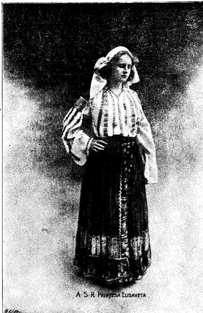
A. S. R. PRIMĂSA ELISAVETA

O muncă uriașă să așteaptă dela cărturarii Români, prin urmare și dela studențime pe terenul delăturării analfabetismului, care taie aripile oricărui avânt spre înaintare. Eil și dacă cutare tinăr din anii trecuți a dovedit rezultate frumoase în instruirea analfabeților în vre-o comună din Bănat, nu i-s'ar mai află oare căți-va tovarăși la o muncă atât de sfântă a regenerării masselor?! Să încerce numai fiecare în comuna sa și vom vedea, câtă mulțumire sufletească ne va produce faptul pornirii neștiutorilor de carte pe calea învățaturii!