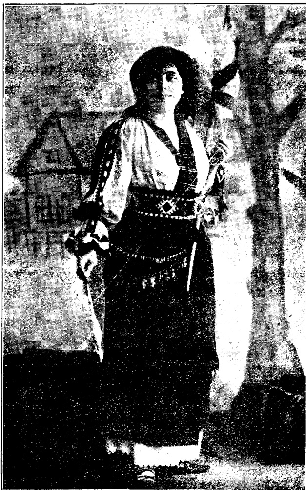
Costum din Toplița.

Credem, că suntem îndreptățiți a fixa măcar în parte condițiile, fără de cari — după modesta noastră părere — un internat academic în Cluj