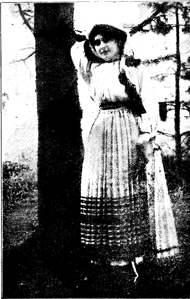
Costum din Orăștie.

Iar în urmă, ca să dăm dovadă, că suntem vrednici a nu mai fi copii nimănuiei, ci să avem un părinte bun: »Internatul Petran«; ca să dovedim, că nu numai cere, dar și jertfi știm din mult-puținul nostru, noi subsemnații promitem pe cuvânt de onoare și cu jurământ sfânt a plăti