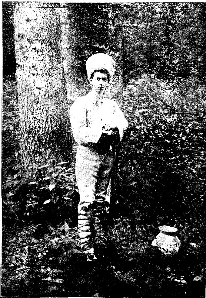
A. S. R. Principele Carol în costum de cioban.

Mulți factori și-au luat partea lor din crearea situației noastre actuale; partea leului însă să atribue clasei intelectualilor, respective conducătorilor naturali ai țărânilor, cari pre lângă tranșarea măruntelor afaceri private au stăruit mult-puțin și pentru înălțarea neamului. Să zicem, că intelectualii noștri în genere și-au achitat datoria lor față de națiune, cu toate-că e proverbială nepăsarea unora față de tot, ce e chemat să dea altă înfățișare colinelor și traiului românesc. Constatarea acestui rău însă nu să ține de