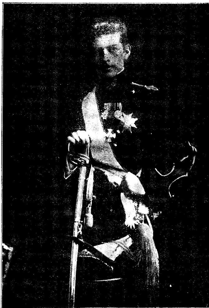
A. S. R. Principele Carol în uniformă de locotenent în batalionul 6 de vânători.

Prima fotografie ni 'L arată pe Alteța Sa în atitudine gânditoare, pare că ar fi în mijlocul studiilor, aprofundând o problemă de viață adânc tăietoare în viitorul său. Aceasta atitudine de conștientioasă datorință trebuie să fie în sufletul