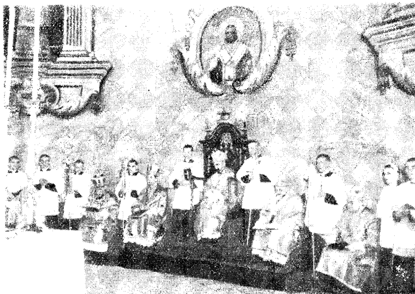
Arhieriei în altar. după Evanghelie.