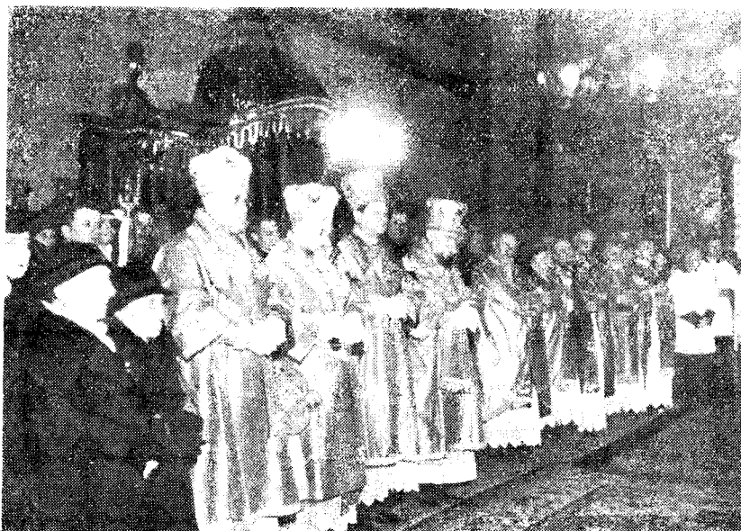
Arhieriei ascultă în picioare Scrisoarea S. Părinte.