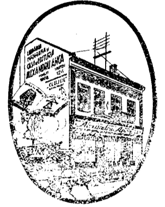
Casa de editură ALEXANDRU ANCA