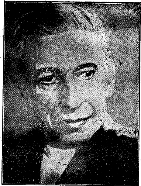
Prof. Dr. N. C. Paulescu

În afară de colaborarea cu profesorul Lancereaux, marele