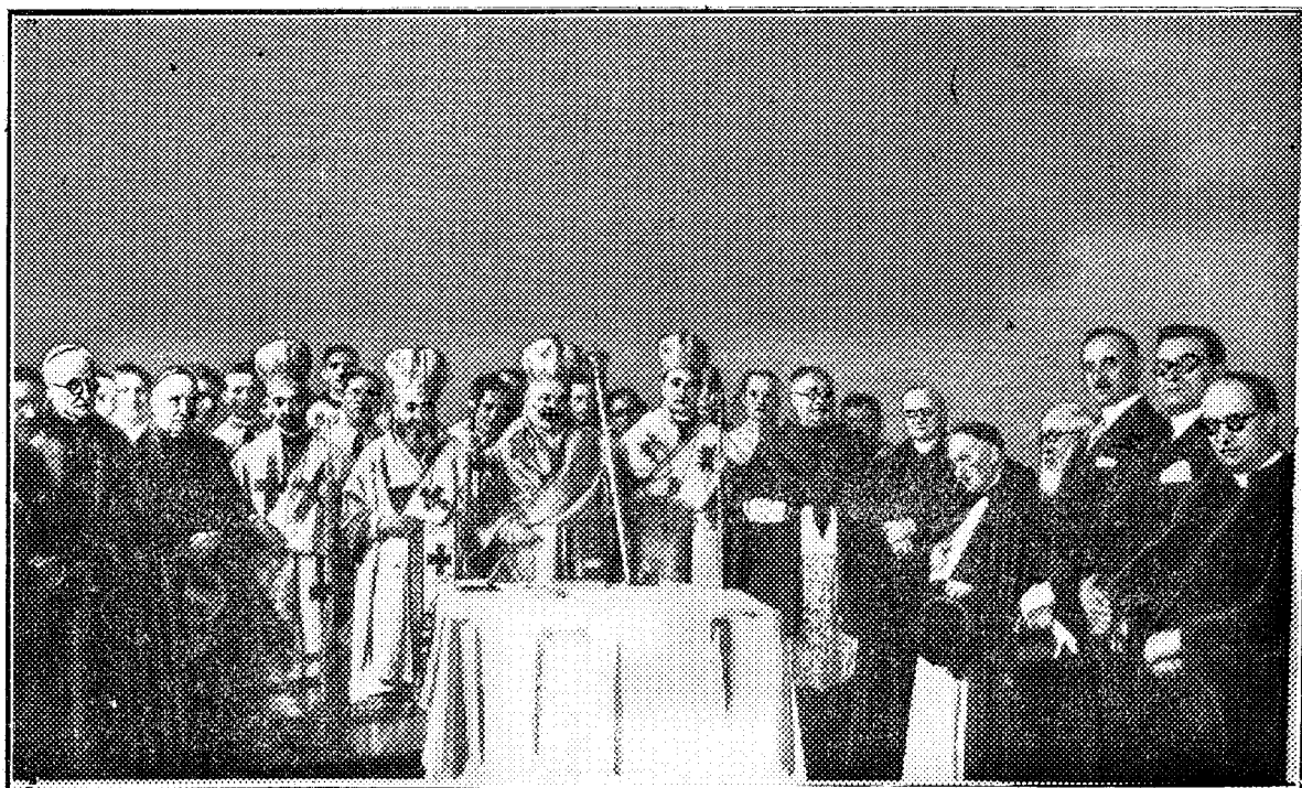
Ceremonia religioasă cu prilejul așezării pietrii de temelie a Seminarului românesc din Roma.

provinciile deplin romanizate din dreapta Dunării. Dând apoi ființă orașului Prima Iustiniana, în locul său natal, împăratul Iustinian strămută aci, la 535, arhiepiscopia Illyricului, dependentă de Roma. Acestei arhiepiscopii îi erau supuși și creștinii din nordul Dunării, strămoșii nostri. Și când, în urma năvălirii Slavilor din veacul VII, arhiepiscopia Illyricului fu strămutată la Tessalonic, străbunii nostri, latini după sânge și latini după credință, ascultară de arhiepiscopul de Tessalonic. Așa încât regretatul Vasile Pârvan putu să spună că: „Organizarea biserii creștine latine din Dacia lui Traian s'a făcut în directă atârănare de