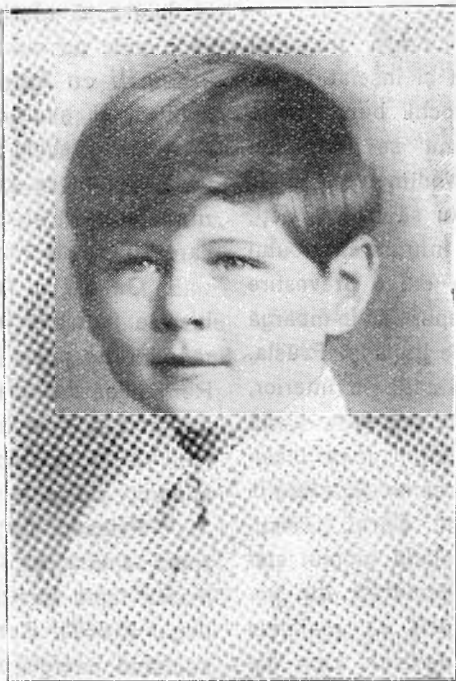
M. S. REGELE MIHAI I.