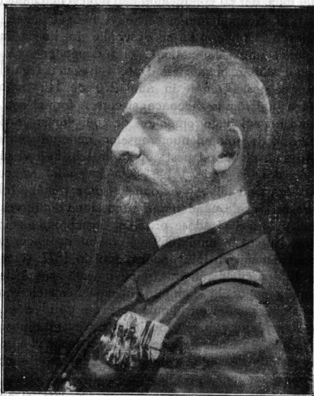
† REGELE FERDINAND I.

Deșteaptă-te Române! din somnul cel de moarte, In care te-adânciră barbarii de tirani! Acum ori niciodată croește-ți altă soartă! La carea să se 'nchine și cruzii tăi dușmani!