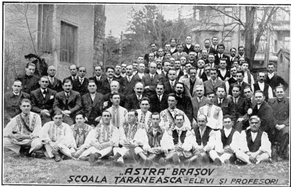
Cursiștii Școlii Țărănești 1934