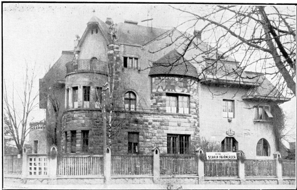
Clădirea Școlii Țărănești 1934