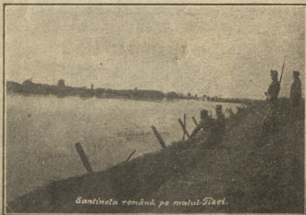
Sentinela română, pe malul Tisei.

Editura Librăriei Alex. N. Leon & Co.—Focșani.